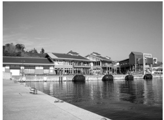
フェリーの発着所でもあり、売店や食堂も併設された海士町の玄関キンニャモニャセンター

そして、攻めの実行部隊となる産業3課（観光と定住対策を担う「交流促進課」、第一次産業の振興を図る「地産地商課」、新たな産業の創出を目指す「産業創出課」）を設置し、その3課を役場の庁舎ではなく、町の玄関で、情報発信基地であり、アンテナショップでもある港のキンニャモニャセンターのワンフロアに置いた 8) 。