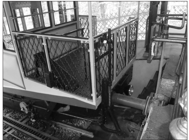
図-3 水力ケーブルカーの上駅での注水。注水パイプが車両の取水口に自動的にはめ込まれる。

発電は、自然エネルギーの一つの可能性として、大きな期待を担っている。陸地における自然界の水の流れは、重力の作用で高低差を利用して起きるのであるが、そのために水の流れのエネルギーは、高低差に比例する。大規模ダムではダムを利用して、局地的な高低差を人工的に増幅させているわけだが、小水力では発電機の設置場所は固定されているので、高低差の効率的利用はあまり望めない。それに対して水力ケーブルカーは、水とともに移動することにより、例えばヴィースバーデンのように、ほぼ100mの高低差を直接利用することができる。水力の潜在能力を最大限発揮できるのである。