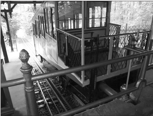
図-2 ヴィースバーデンの水力ケーブルカー

ジュス教会が威厳を保ちながらも、人をやさしく包み込むように立っている。信者は険しい坂をこの教会での礼拝のためにくねくねと上って行くのであるが、登山道の入り口に、年老いた人病弱な人を救うように、水力ケーブルカーの下駅があり、ボンジュス教会のすぐ近くの上駅まで運んでくれる。この付近の山は湧水が豊富で、流れる湧水を利用した、自然エネルギー有効利用の移動手段として、この水力ケーブルカーはやはり19世紀末から現在に至るまで、市民や巡礼者、観光客の足として稼働を続けている。